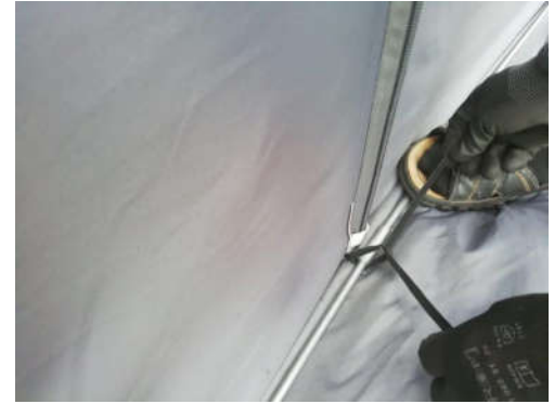
Lopuksi tankoa hellästi jalalla tukien narut solmuun. Sitten kiilat helmoihin sekä tarvittaviin naruihin.