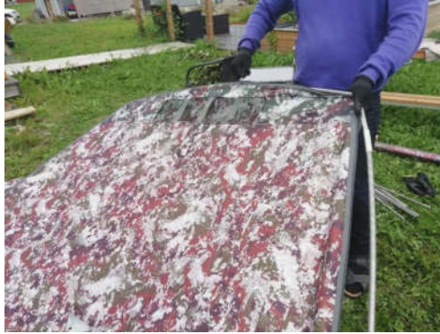
Vetoketju kanavasta kiinni, kannattele kangasta