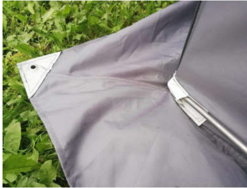
Pitkiä tankoja on kolme, kaksi laitetaan helmoihin Aloita laittamalla tanko päistä vahvikkeisiin