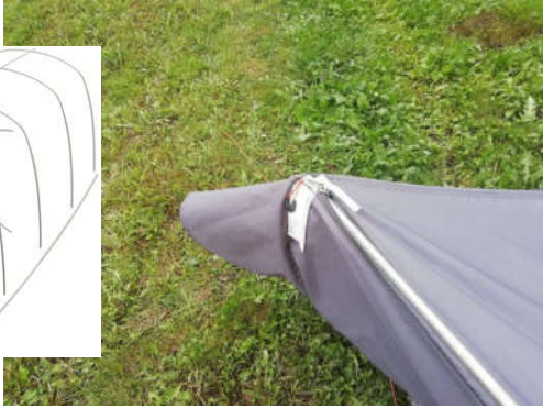
Kaaria on 5kpl rennosti-4 ja 4kpl rennosti-3, laita kootut kaaret päistä vahvikkeeseen.