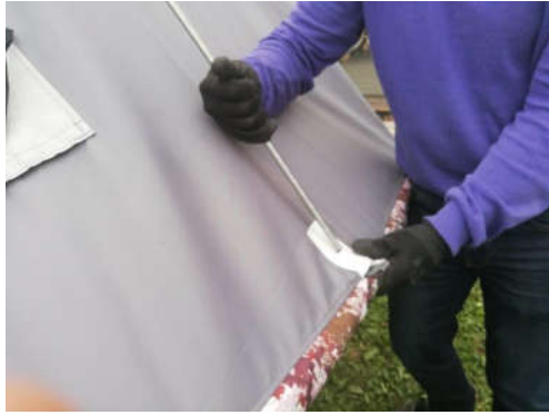
Ennen viimeistä narua, laita tanko päätyvahvikkeeseen.