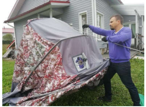
Pitkä tanko harja vahvikkeeseen ja työnnetään "haitari" auki.